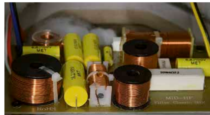
Ordentliche, aber nicht exotische Bauteile finden sich in der Weiche

Millimetern sicherstellen. Darüber hinaus tritt man restlichen Vibrationen auch mit Idikell-Dämpfungsfolie, die auf Bitumenbasis hergestellt wird, entgegen. Im mehr als 70 Kilo schweren Gehäuse tummelt sich ganz oben das eigentliche Sahnestück der Box, der weltweit einzige koaxial aufgebaute Bändchenlautsprecher. Hier befindet sich im Zentrum der Fläche der Hochtöner, der von der Mitteltönerfolie umgeben ist. Doch nicht nur die auf allen Achsen perfekte Zeitrichtigkeit macht die Qualität dieses in Handarbeit entstehenden Chassis aus, sondern der Feinschliff bei Antrieb, Feldgeometrie, Ätztechnik, Folienmaterial, Membrangeometrie sowie die spezielle Membran- und Hohlraumbedämpfung. Ergebnis: Der Treiber ist sehr breitbandig einsetzbar und hat doch einen Wirkungsgrad, der sechs bis zehn Dezibel höher liegen soll als bei den Wettbewerbern. Daraus resultieren weitere Pluspunkte wie höchste Verzerrungsarmut und die