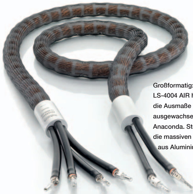
Großformatig: Das LS-4004 AIR hat fast die Ausmaße einer ausgewachsenen Anaconda. Stolz auch die massiven Splitter aus Aluminium.

phile Spiel zu bringen. Wie überhaupt auch die Stecker eine neue Konstruktion von in-akustik sind. Statt Messing gibt es hier Tellurium-Kupfer, das eine doppelt so hohe Leitfähigkeit aufbringen kann. Die Stecker selbst bestehen aus einem Basis-Terminal und einem über ein Scharnier beweglichen Vorderteil, das frei konfektioniert werden kann – als Kabelschuh oder Banana-Stecker.