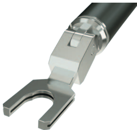
Die Alternativversion: Wer will, kann sein LS-4004 AIR auch mit einem Kabelschuh ordern.