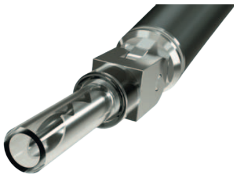
Der Klassiker: das LS-4004 AIR, hier in der Version mit Banana-Stecker und Schutzhaube.