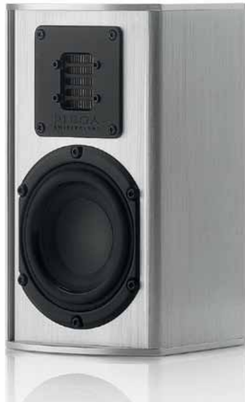
Piega TMicro 40 AMT-1 und TMicro Sub